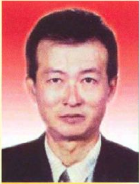
两光 本会主席 奖学金顾问,名誉会长